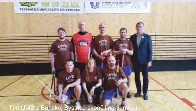
Tím UMB z Banskej Bystrice skončil na 3. mieste