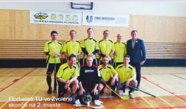
Florbalisti TU vo Zvolene skončili na 2. mieste