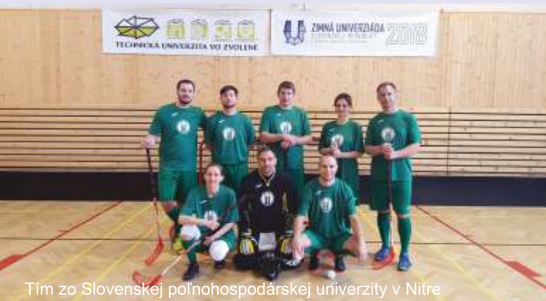
Tím zo Slovenskej poľnohospodárskej univerzity v Nitre