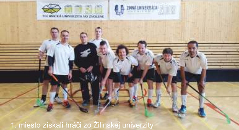
1. miesto získali hráči zo Žilinskej univerzity