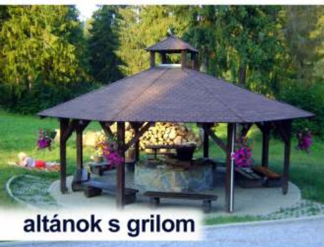
altánok s grilom