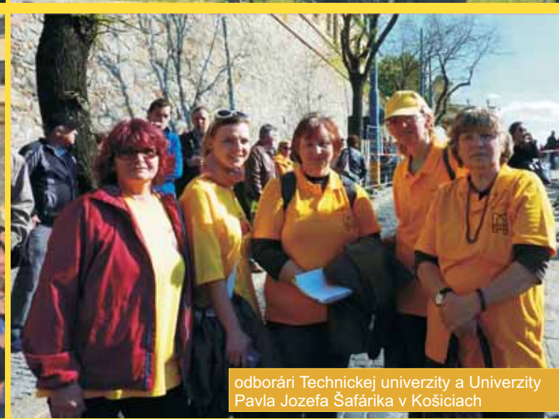
odborári Technickej univerzity a Univerzity Pavla Jozefa Šafárika v Košiciach