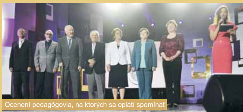
Ocenení pedagógovia, na ktorých sa oplatí spomínať