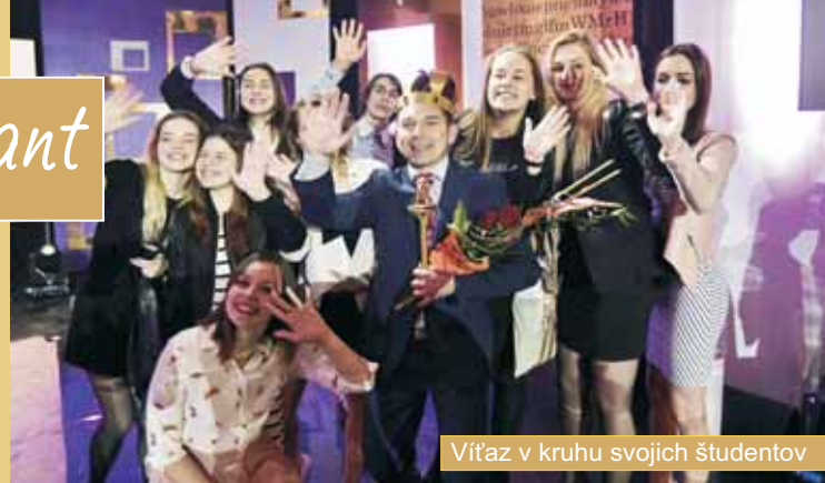
Víťaz v kruhu svojich študentov