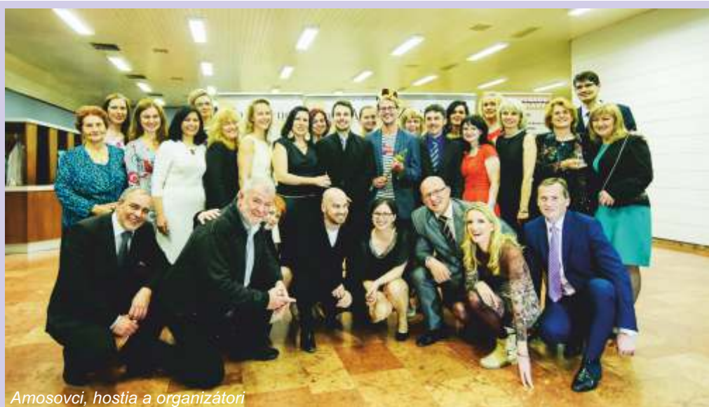
Amosovci, hostia a organizátori