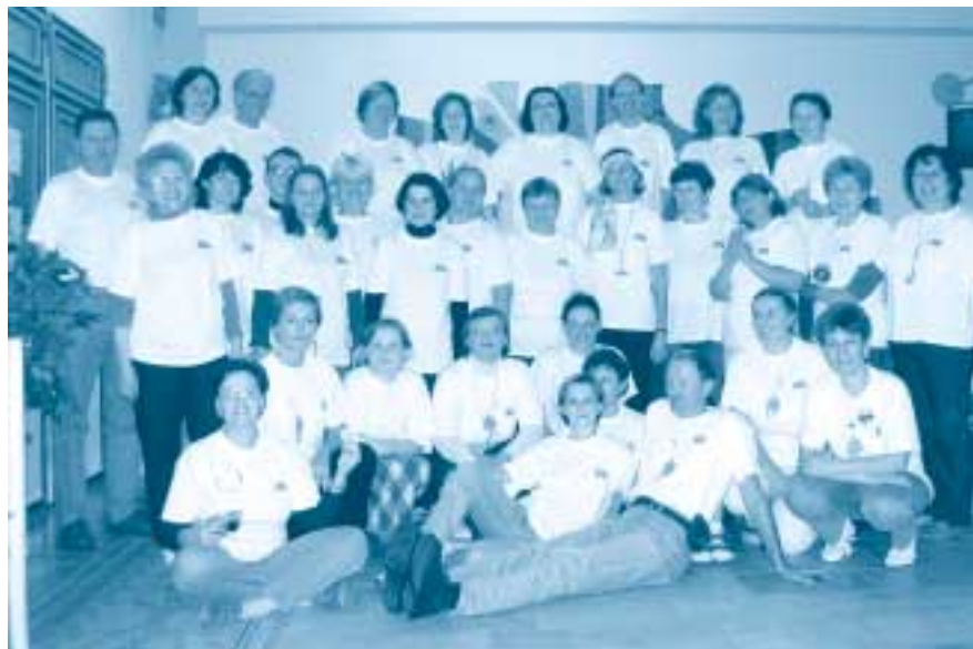
Účastníci zájazdu „Rodomtúr“

Naša skupina cestovateľov z SPŠE na ulici K. Adlera v Bratislave tieto nádherné miesta už pozná vďaka „... súkromnej cestovnej kancelárii, spoločnosti bez obmedzenia“.