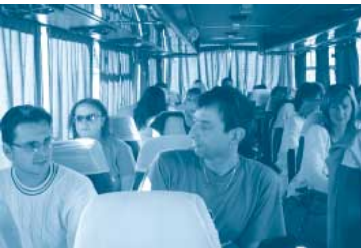
Pohľad na účastníkov