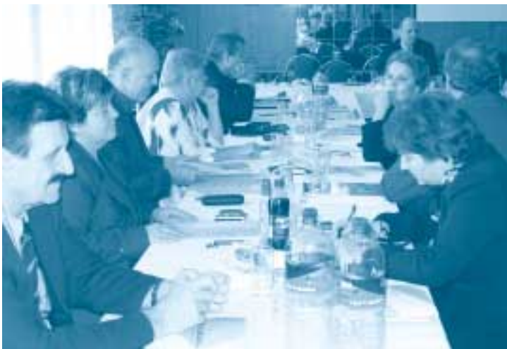
Pohľad na zástupcov KŠÚ a VÚC